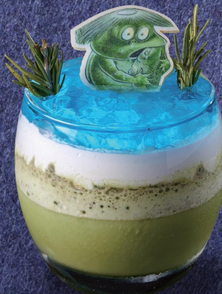
河童の抹茶スムージー 1,050円