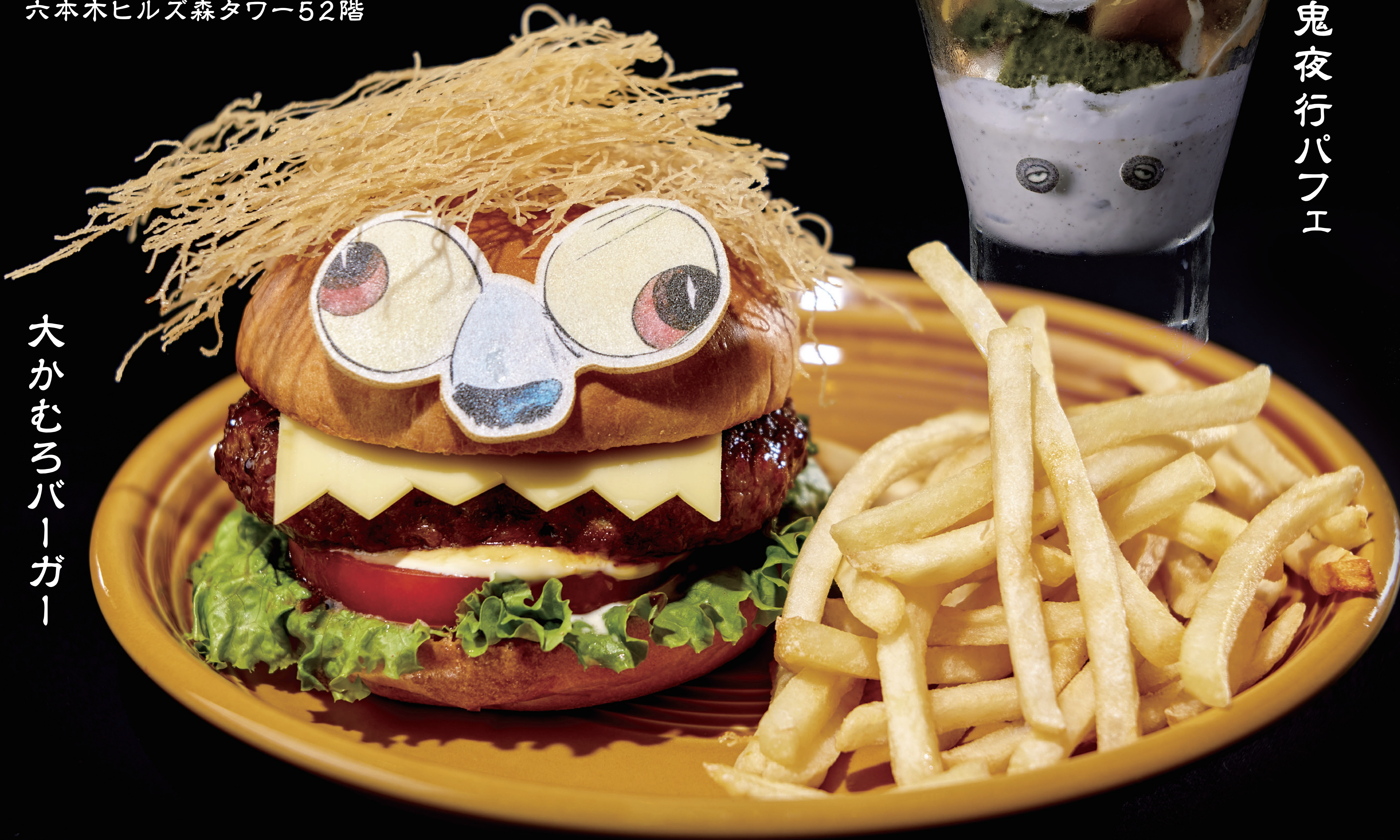
大かむろバーガー