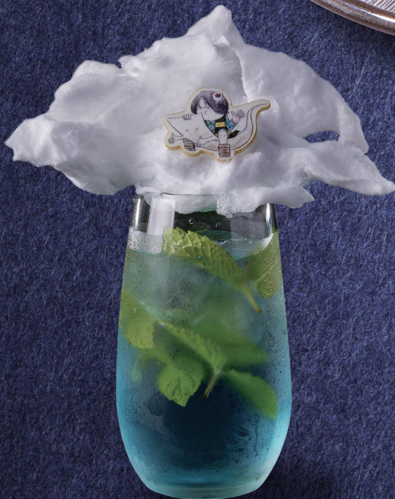
鬼太郎と一反もめんの 空の散歩 1,080円