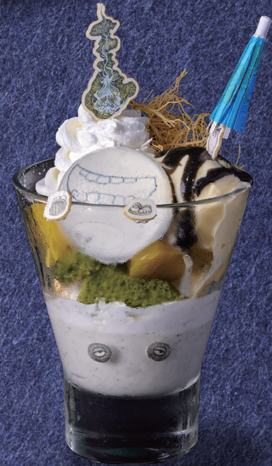
百鬼夜行パフェ 1,480円