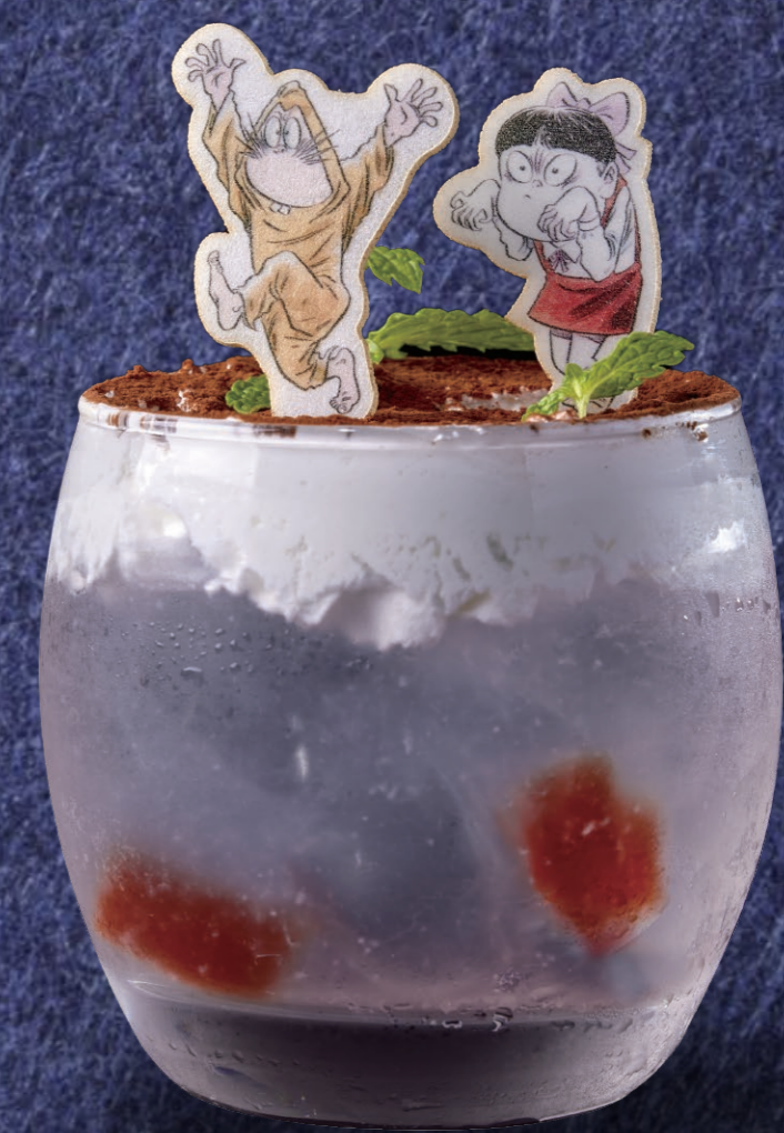
ねこ娘のライチソーダ 1,100円