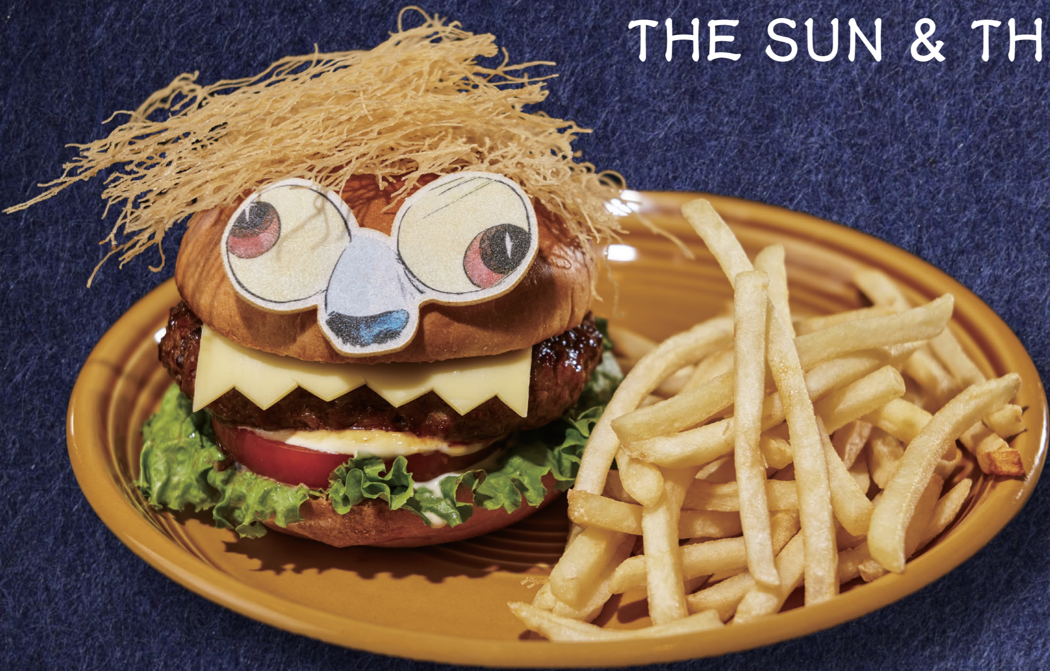
大かむろバーガー 1,550円

全てのメニューに、 特製ランチョンマットがついてくる！ ※お一人様につき、1枚お渡しします。 ※前期・後期でデザインが変わります。