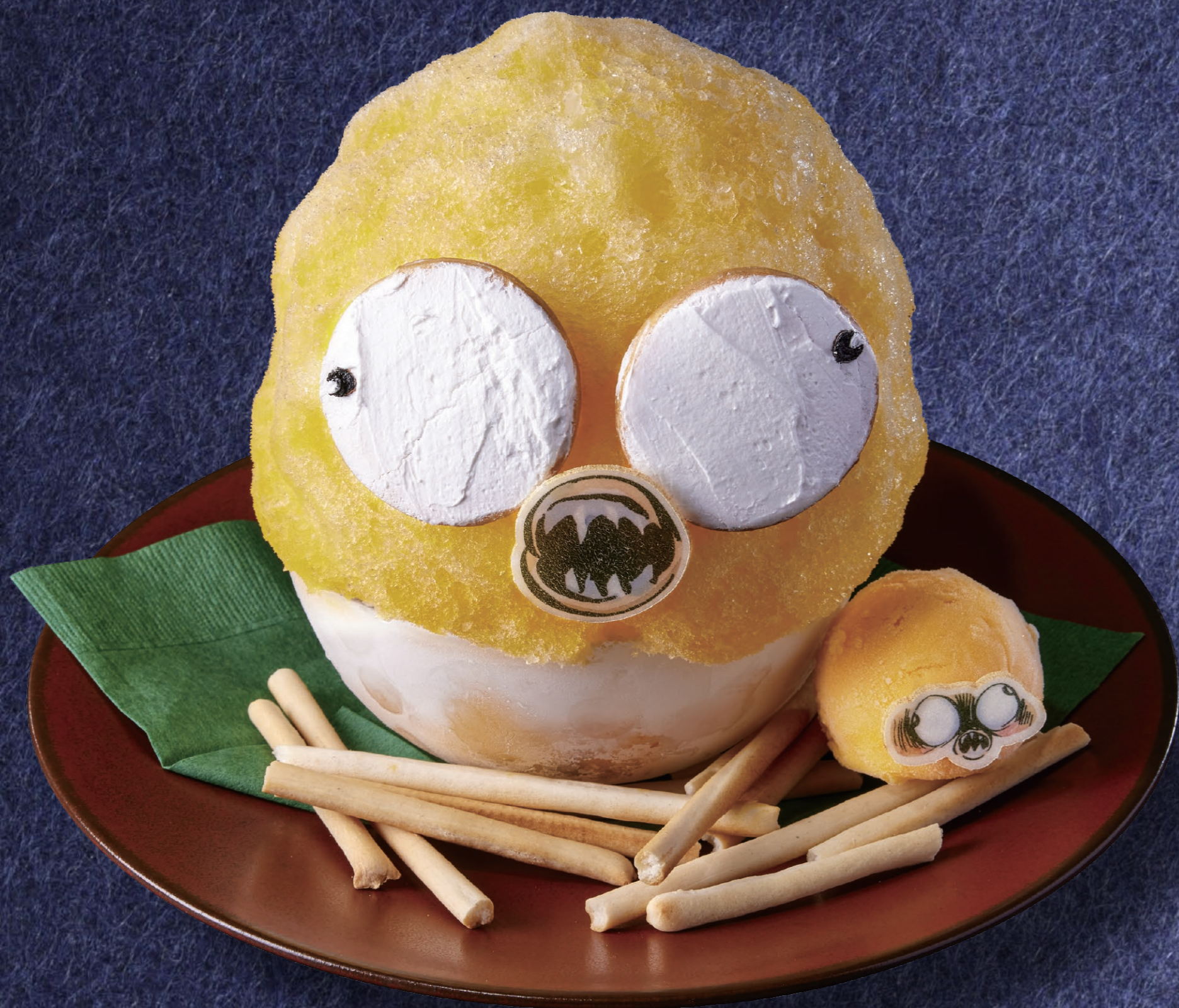
前期 7月8日(金)~8月5日(金) キジムナーの マンゴーかき氷 1,380円