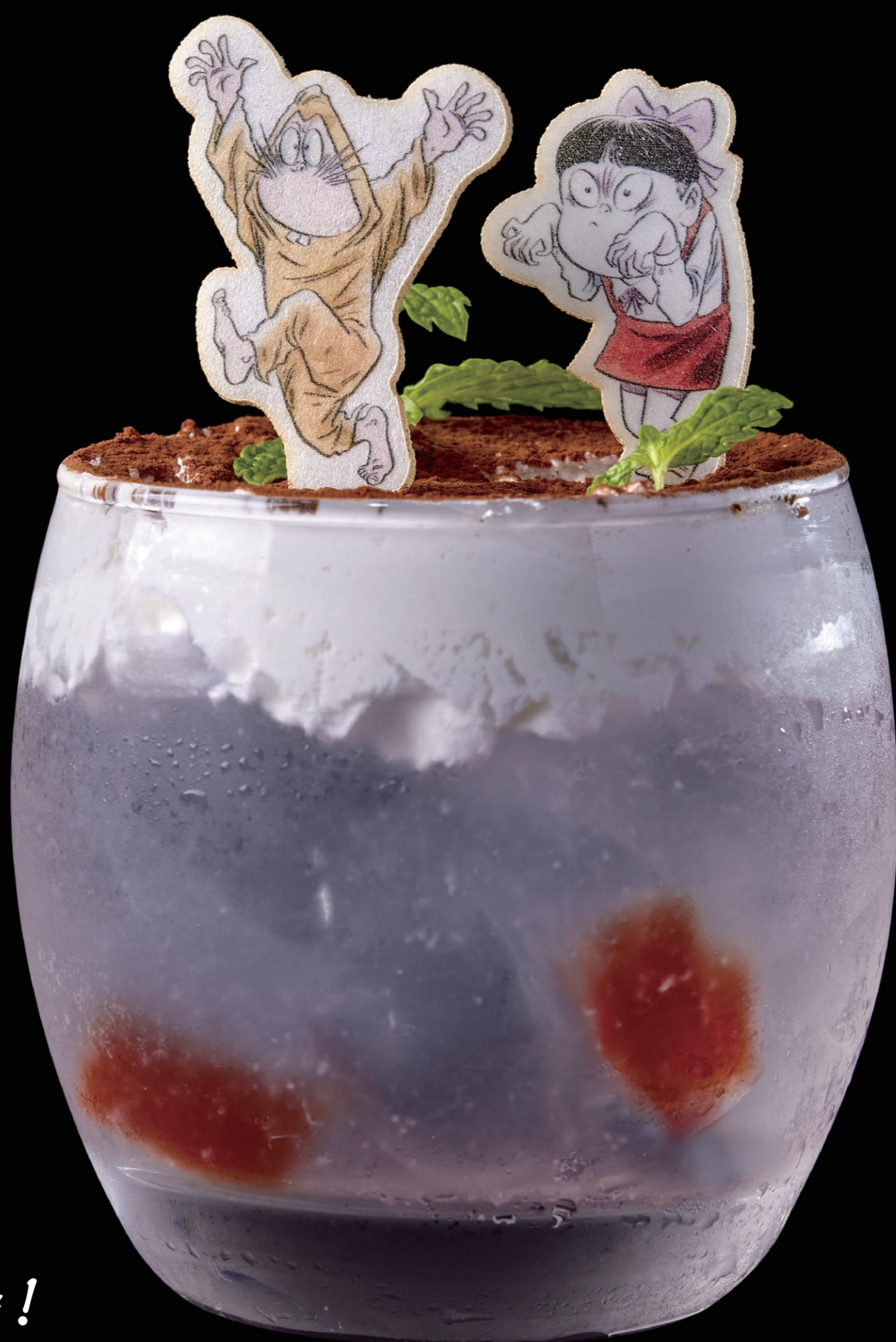
ねこ娘のライチソーダ