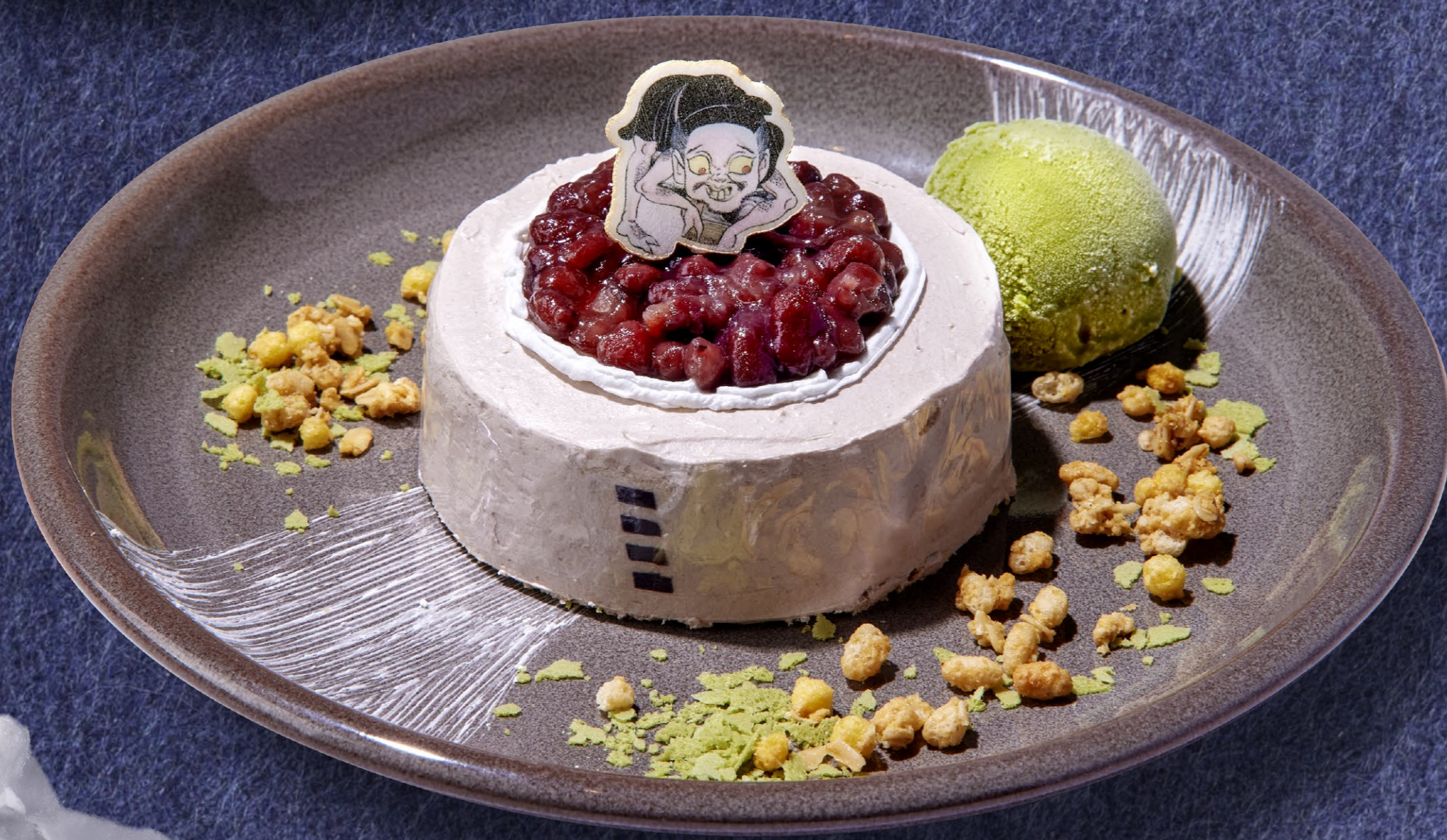
後期 8月6日(土)~9月4日(日) 小豆洗いの たらいシヨートケーキ 1,350円