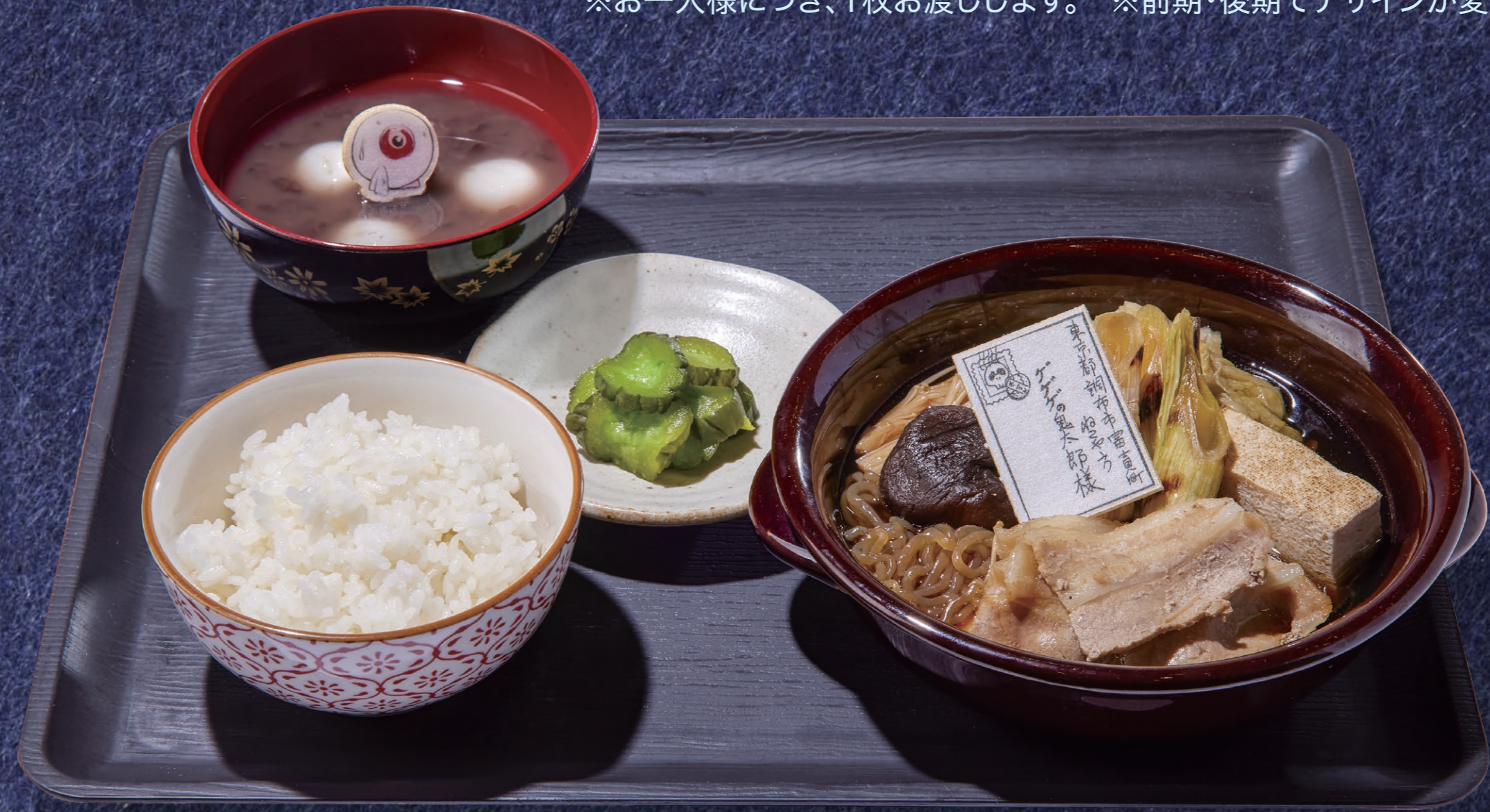
深大寺の すき焼きパーティー定食 1,600円