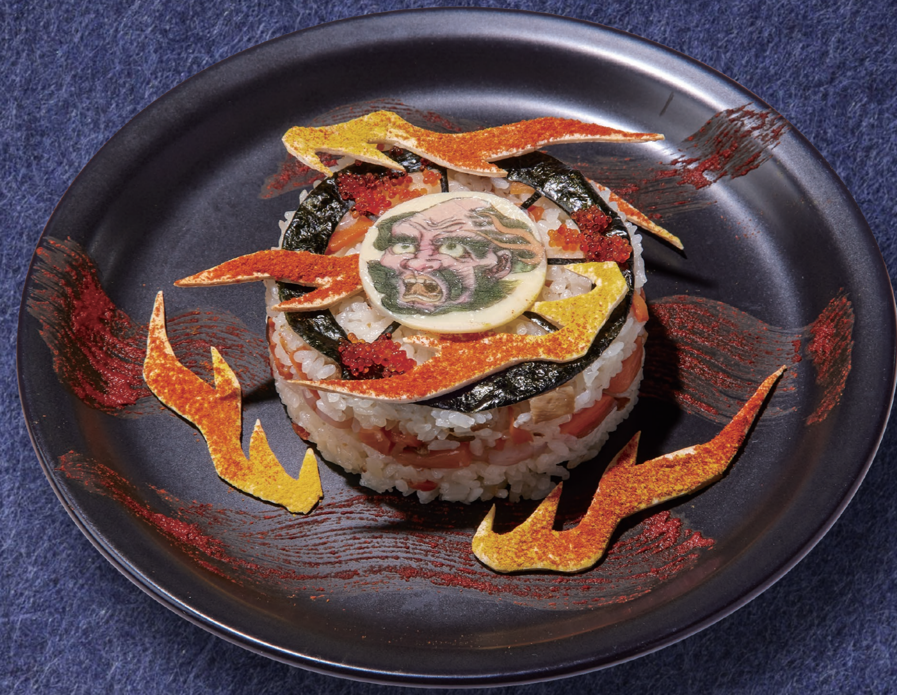
輸入道の 海鮮ちらし寿司 1,580円