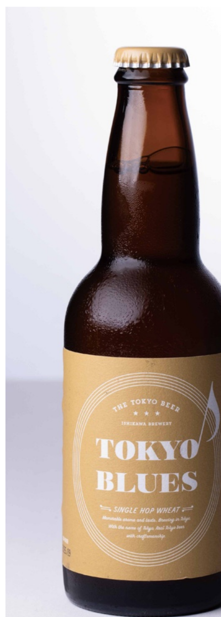
Tokyo Blues シングルホップウイート Tokyo Blues Single Hop Wheat ¥1,300

麦芽の芳醇な旨味、上質なアロマホップによるフローラルで爽やかな香りと苦味が絶妙なバランスの淡色系のビールです。