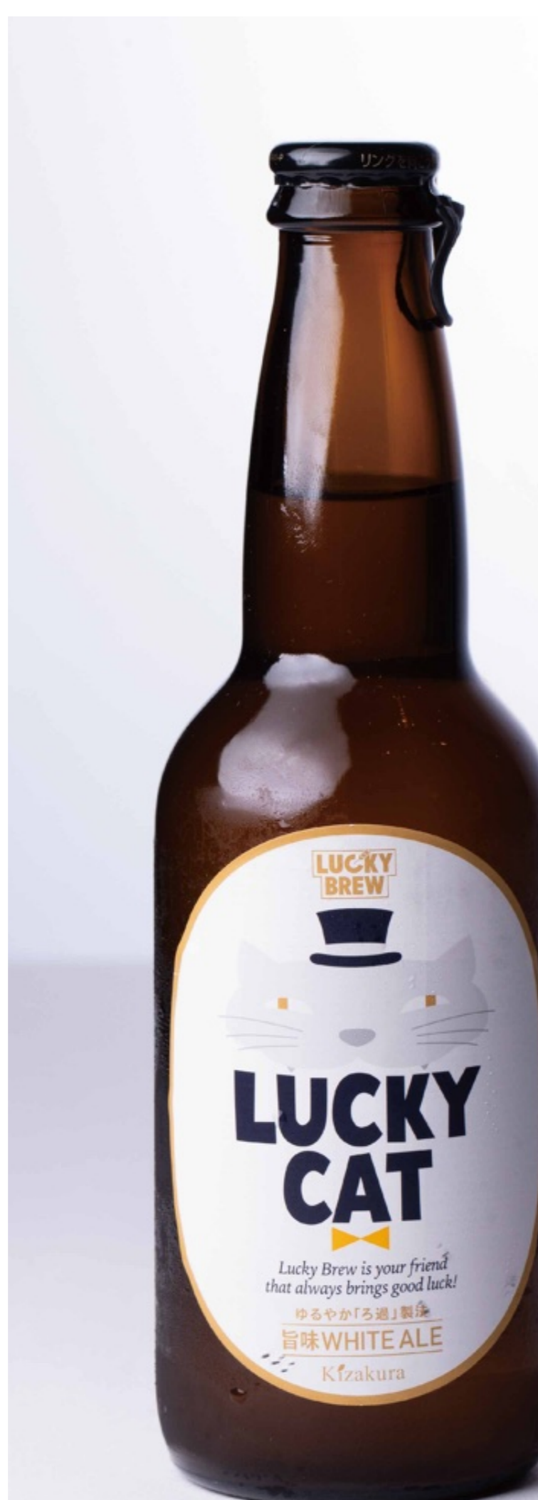
ラッキー キャット Lucky Cat ¥1,100

やわらかな甘さ、素材の味を引き出したやさしい味わい、おだやかな苦味、オールモルトビールとは思えない飲みやすさ。アロマホップから生まれる柑橘系の澄んだ香味。