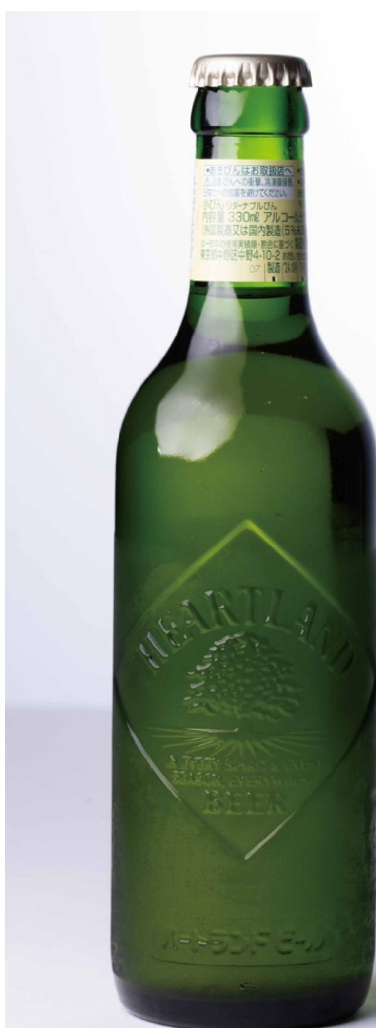
ハートランド Heartland ¥850

やわらかな甘さ、素材の味を引き出したやさしい味わい、おだやかな苦味、オールモルトビールとは思えない飲みやすさ。アロマホップから生まれる柑橘系の澄んだ香味。