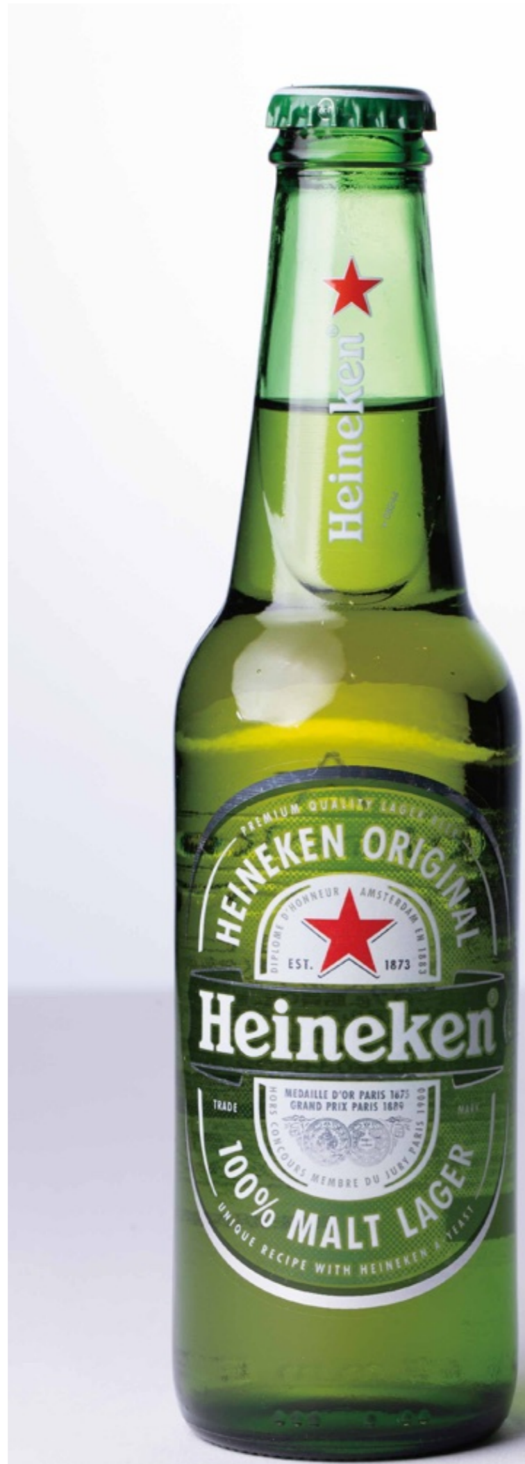
ハイネケン Heineken ¥850

透き通ったゴールド、りんご、オレンジ、バナナのようなフルーティーな香り、ショウワヤクローブのようなスパイシーな香りもあります。