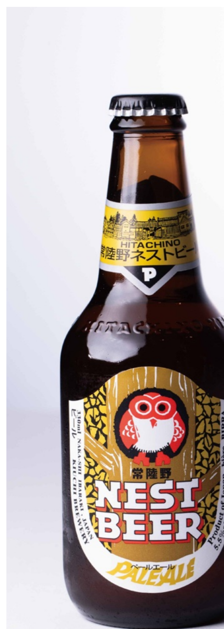
常陸野ネスト ペールエール Hitachino Nest Pale Ale ¥1,200

京都の名水で造られるラッキー、素晴らしい原材料で造られるラッキー、勝利のブルワーに造られるラッキー、いろんなラッキーとの出会いから生まれた、今までになかった新しいビールです。ゆずの香りと和山椒の隠し味が料理の味をおいしく引き出します。