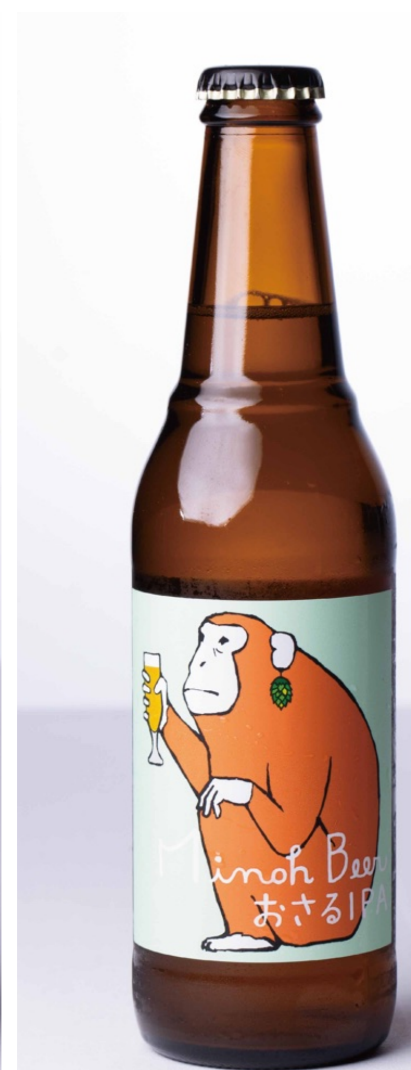
おさる IPA (箕面ビール) Osaru IPA ¥1,300

ドイツ伝統の白ビール、ヴァイツェンスタイルの味わいを東京の感性で仕上げました。小麦麦芽が奏でるまるやかな口当たりのなかに、希少なシングルホップ由来の白ワインを思わせる華やかな香りと品の良い苦味が顔をのぞかせる。