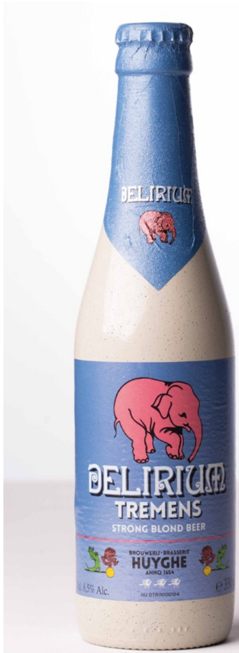
デリリウム・トレメンズ Delirium Tremens ¥1,500

透き通ったゴールド、りんご、オレンジ、バナナのようなフルーティーな香り、ショウワヤクローブのようなスパイシーな香りもあります。