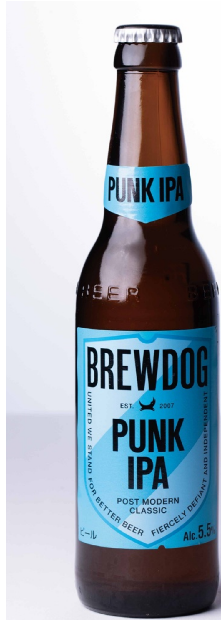
ブルードック パンク IPA BrewDog PUNK IPA ¥1,300

148年以上にもわたる、ハイネケンには世界で最もアイコン的なビールブランドのひとつ、グリーンボトルのレッドスターが、よく冷えたさわやかな口当たりの中に繊細なフルーティーノートと、リッチでバランスのとれた味わいをお届けします。