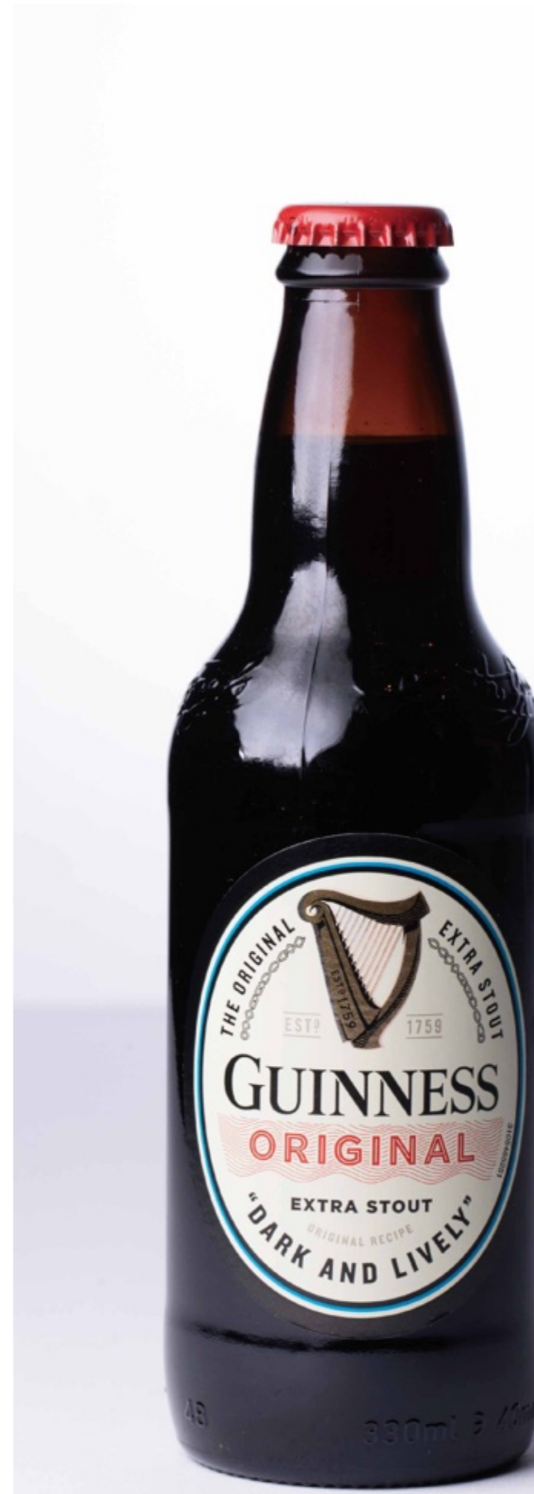
ギネス Guinness ¥900

軽やかな黄金色のクラシックビールは、新世界のホップを使って爆発的な風味を生み出した。グレープフルーツ、パイナップル、ライチのようなトロピカルフルーツとキャラメルの香りが漂い、最後にシャープな苦味が残る。